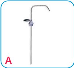
Pojednostavljeni dekanting sistem Ref.: ACC-DERMATO-1